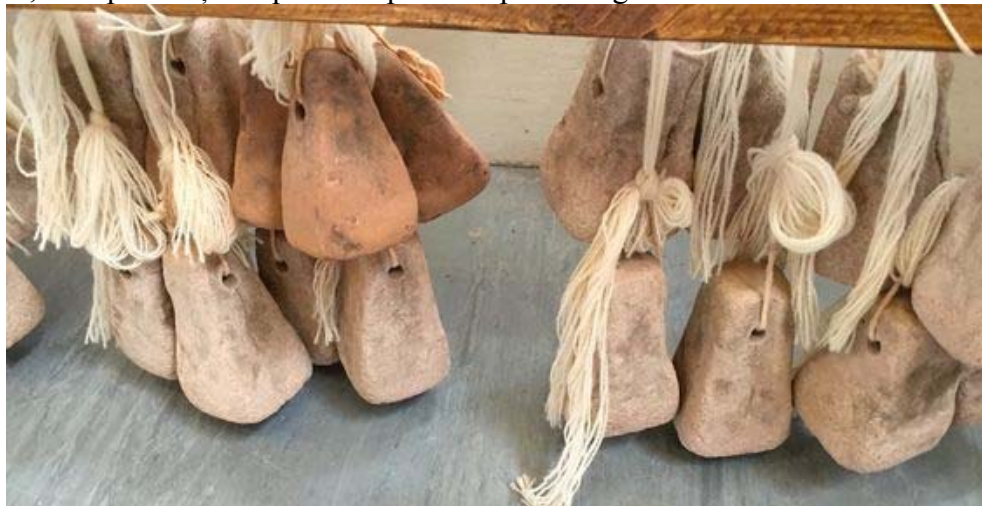
Greutăți din lut de epocă romană

Pentru a menține tensionate firele de urzeală se foloseau greutatea modelate din lut. Acestea sunt adeseori singurele elemente păstrate ale războaielor de țesut, descoperite arheologic. Sunt piese deseori nedecorate, de diferite forme, cu o perforație în partea superioară pentru legarea firelor.