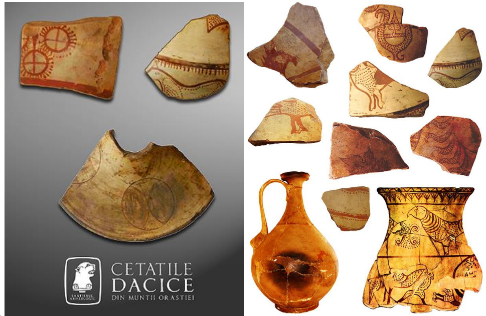
Ceramică dacică pictată

contact@virtusantiqua.ro Cristian Roman: 0744997138