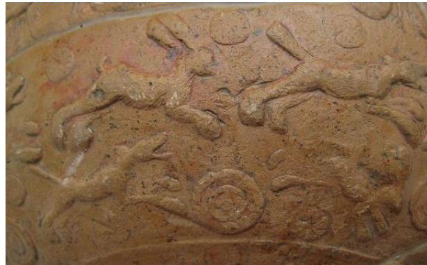
Scenă de vânătoare pe un vas tip terra sigillata

contact@virtusantiqua.ro Cristian Roman: 0744997138