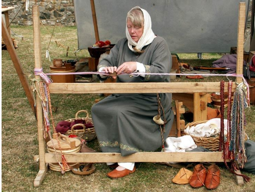
Suport orizontal pentru țesut cu tablete

Existau însă diferite modalități de fixare a capetelor de urzeală, unele presupunând elemente complexe, asemănătoare războaielor de țesut. În acest caz, ocupația care le revenea probabil femeilor, nu mai era atât de mobilă ci era practică în context domestic.