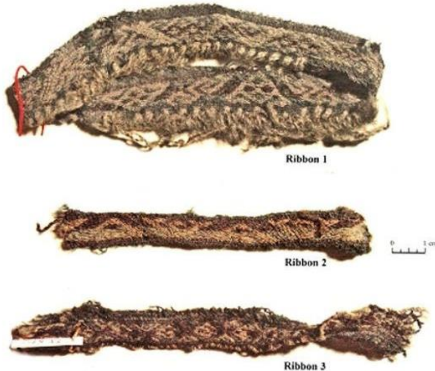
Benzi decorative descoperite arheologic în minele de la Hallstatt, Austria

Proiectul nu reprezintă în mod necesar poziția Administrației Fondului Cultural Național. AFCN nu este responsabilă de conținutul proiectului sau de modul în care rezultatele proiectului pot fi folosite. Acestea sunt în întregime responsabilitatea beneficiarului finanțării.