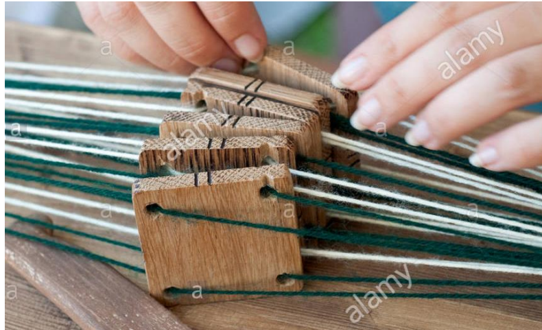
Model de țesut cu 6 tablete

Așa numitul țesut cu tablete este o modalitate mai simplă de a țese, care nu necesită un război propriu-zis și care era folosită și de către populațiile barbare. Datorită numărului relativ redus de fire de urzeală care pot fi utilizate, ea este potrivită brâielor și bordurilor decorative mai înguste, cusute pe îmbrăcăminte sau diverse accesorii.